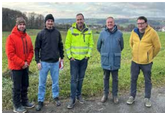
Gemeinsame Analyse: Die Projektbeteiligten begutachten die Einzugsgebiete für mögliche Maßnahmen im Gelände.

Nach längerer Wartezeit konnte die Kommune ein gefördertes Sturzflutrisikomanagement beauftragen. Das Ingenieurbüro Mannax analysiert hierfür seit einigen Monaten die Einzugsgebiete, modelliert Starkregenszenarien und entwickelt mögliche Schutzmaßnahmen.