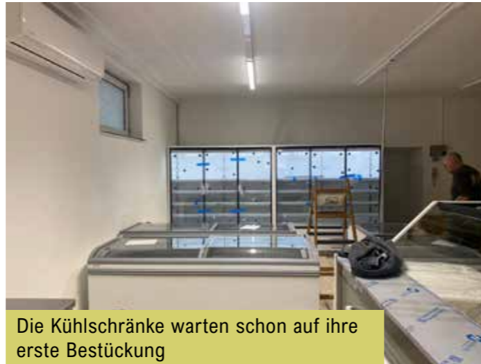
Die Kühlschränke warten schon auf ihre erste Bestückung

FrohNatur ist als fester Bestandteil des Alltags gedacht und soll das Leben in Marktgraitz ein Stück einfacher, lebendiger und unabhängiger machen.