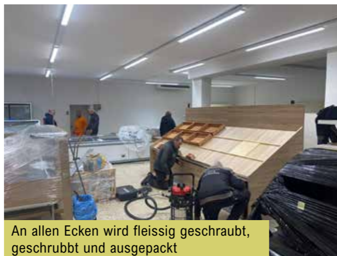
An allen Ecken wird fleissig geschraubt, geschrubbt und ausgepackt