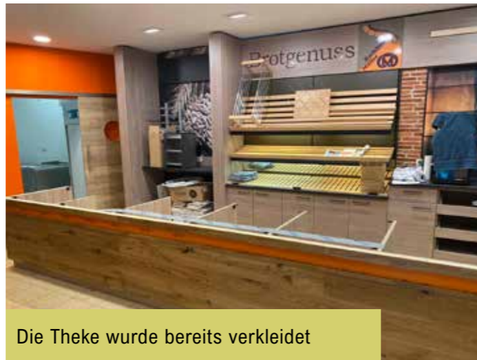
Die Theke wurde bereits verkleidet